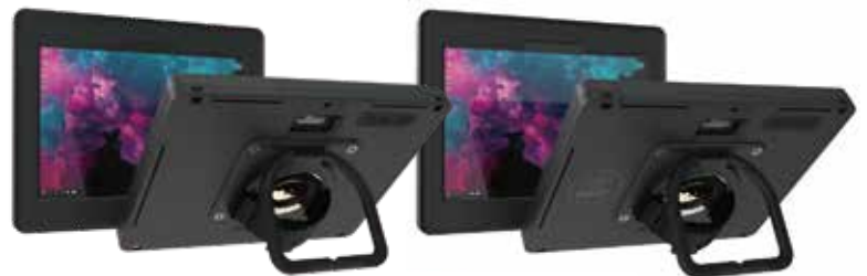
CWM417MP for Surface Go