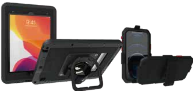
CWA647MP for iPad 10.2"